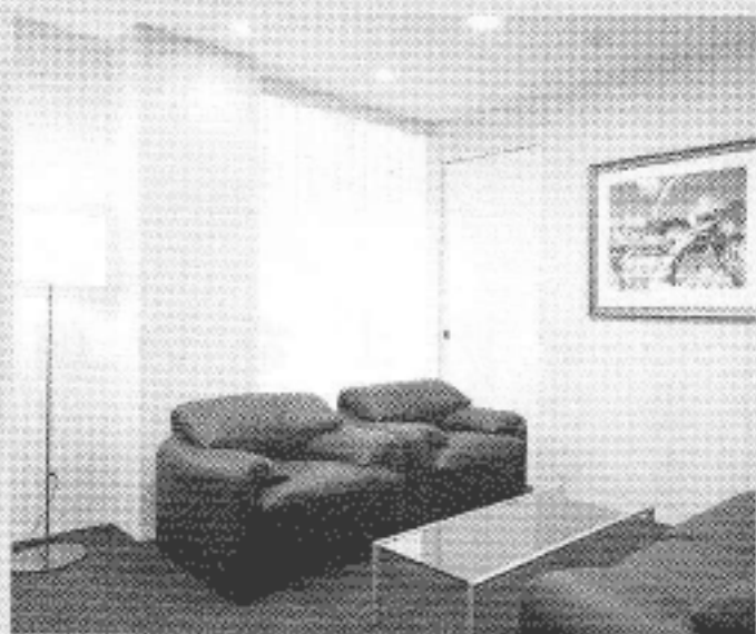
■カウンセリングルーム

ません。そこで、定時にクリニックの一室に「出勤」し、徐々に復職に向けたプログラムを行っていたが、併設の「メディカルサポート薬院」は、ひとりで言うなら「セカンドオピニオン外来」です。精神科だけでなく、外科や内科等、広く、当院以外で受けている診断や治療についてのご相談をお受けしています。 今後の精神科医療は、「うつ病」「認知症」「ストレスケア」対策が重要と考えられます。昨年五月には、河野名島病院にホテル並みのアメニティとパソコン等のビジネスツールを備えたストレスケアのための「プレミアムルーム」を設置し、働き盛りのエグゼクティブの方々には好評を得ています。現在、新病棟を計画中の河野粕屋病院にも、ストレスケアや認知症対応の施設を取り入れる予定です。青壮年の方々の「予防」から高齢者の方々の「看取り」まで、あらゆる年齢層の方々のメンタルケアをトータルに行い、「受診して良かった」と思える病院づくりに努めたいと考えています。