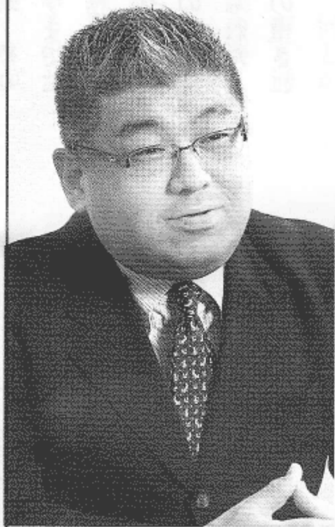
医療法人 済世会 理事長・医学博士