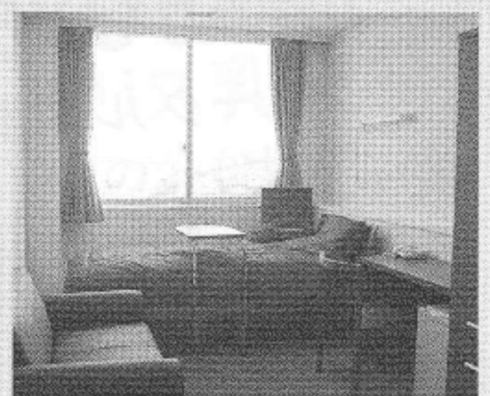
■プレミアムルーム